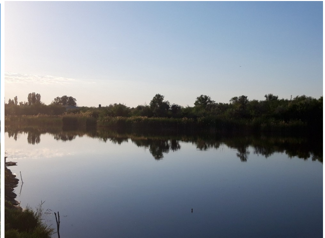
Фотофиксация объекта проектирования