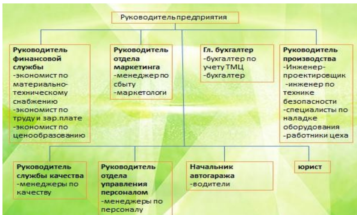
Рисунок 1. Структура управления предприятием.

Цель стратегии инновационного развития модельного предприятия ЗАО «Молочный комбинат» - расширение ассортимента производимой продукции и запуск новой линии по ее производству. Используя структуру управления предприятием (рис.1), определите ответственного руководителя и состав рабочих групп на каждом этапе реализации данного инновационного проекта и опишите их функции. Данные занесите в таблицу 1.