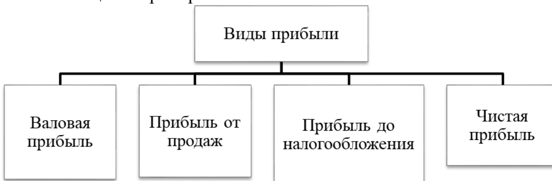
Рисунок 1 – Виды прибыли

Каждый рисунок должен сопровождаться содержательной подписью, которая размещается под рисунком в одну сторону с номером. Название рисунка всегда начинается с прописной буквы, Times New Roman 14, без точки в конце. Например: