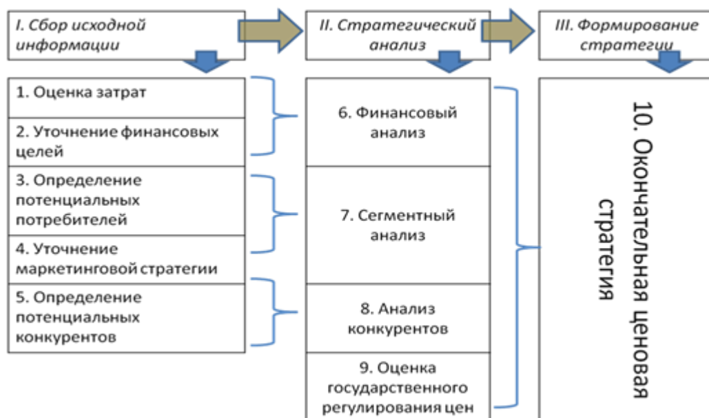
Рисунок 1 – Разработка ценовой стратегии предприятия

Можно выделить этапы разработки ценовой стратегии: