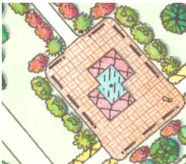
Рисунок 1. План площадки.

Вводная часть. Преподаватель объясняет особенности построения линейной перспективы пейзажа, глубинных планов пейзажа. Выдает индивидуальные задания, содержащие планы площадок.