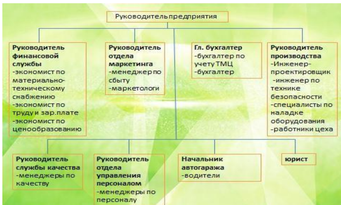
Рисунок 1. Структура управления предприятием.