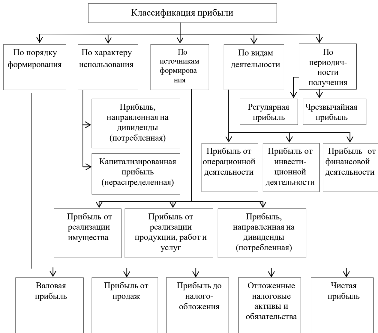
Рисунок 2 – Классификация прибыли

Оформление ссылок. Библиографическая ссылка предусматривает расположение информации об источнике в списке литературы. При упоминании автора работы или работ в квадратных скобках указывается номер источника в пределах списка литературы, например [6]. При ссылке на несколько работ одного автора или работы нескольких авторов приводят номера этих работ, например: [1,7,22]. При ссылке на определенные страницы указывают порядковый номер источника и страницу, на которой расположен данный текст, например: [11, с.72]. Если ссылка на многотомное издание, кроме того, указывают номер тома, например: [12, т.1, с.455].