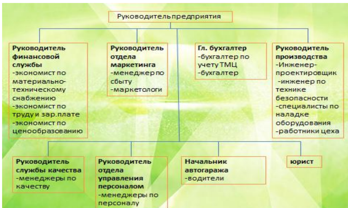
Рисунок 1. Структура управления предприятием.

бочих групп на каждом этапе реализации данного инновационного проекта и опишите их функции. Данные занесите в таблицу 1.