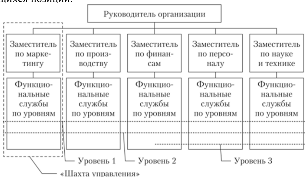
Рисунок 3.1 – Организационная структура предприятия

Если в тексте документа имеется иллюстрация (например, схема), на которой изображены составные части, то на этой иллюстрации должны быть указаны номера позиций этих составных частей в пределах данной иллюстрации, которые располагают в возрастающем порядке, за исключением повторяющихся позиций.