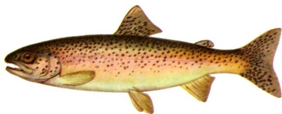
Рис.2. Стальноголовый лосось

Морфологические отличия стальноголового лосося от радужной форели существенны. У стальноголового лосося больше жаберных лучей, короче грудные, брюшные и хвостовые плавники, короче и ниже голова, более сжатое с боков тело. Окраска спины имеет металлический темно-голубой отлив, благодаря которому рыба и получила свое название, бока серебристые, на теле пятна, радужная полоса видна только в период половой зрелости.