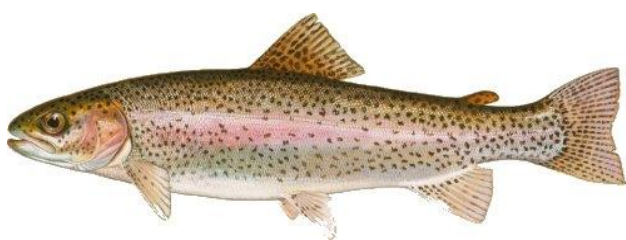
Рис. 1. Радужная форель

Радужная форель получила свое название из-за радужной полосы, которая проходит вдоль тела у взрослых особей. В брачный период эта полоса и жаберная крышка особо ярко окрашены. На спине, по бокам, на хвостовом стебле и плавнике имеется много черных точек. В естественных водоемах радужная форель обитает при температуре 3-21 °С. Нижняя летальная граница температуры 0°С, верхняя 23-27°С. Половая зрелость у самок наступает на 3-4-м году жизни, у самцов на год раньше. Нерест в естественных условиях проходит весной в апреле — мае при температуре 0,3-13 °С, средняя плодовитость самок 3-4 тыс. икринок. Эмбрионально-личиночное развитие проходит наиболее благоприятно при температуре 5-13 °С.