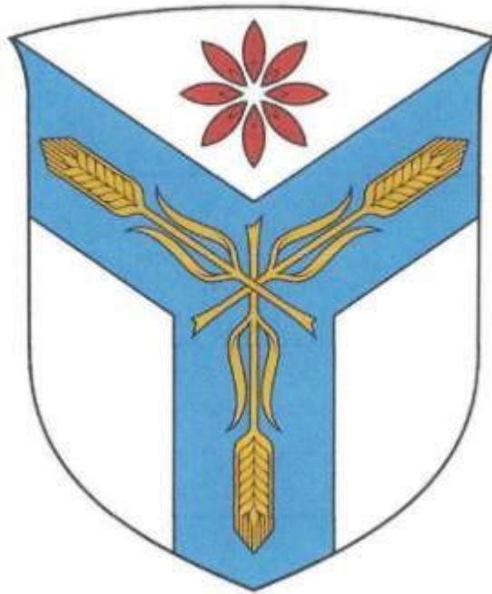
ПОЯСНИТЕЛЬНОЕ ИЗОБРАЖЕНИЕ герба ФГБОУ ВО Вавиловский университет в цвете