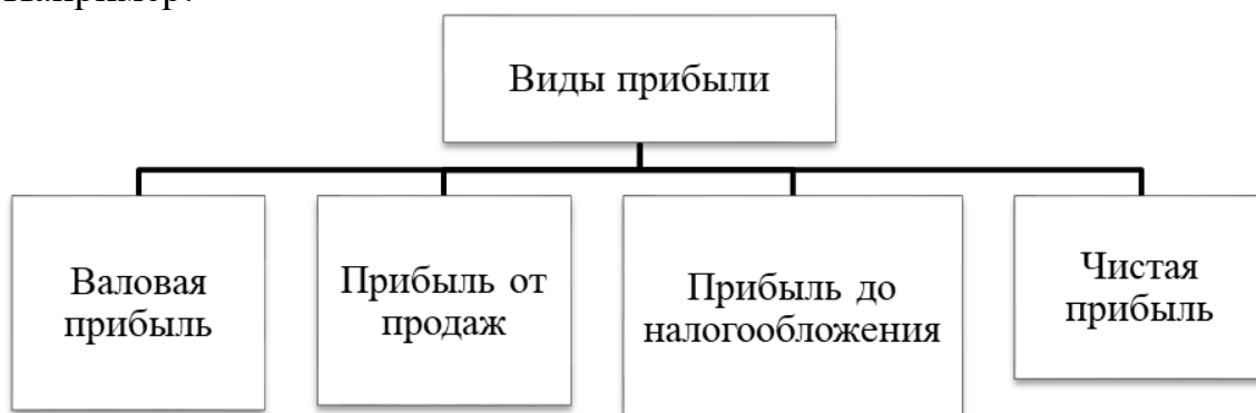
Рисунок 1 – Виды прибыли

Каждый рисунок должен сопровождаться содержательной подписью, которая размещается под рисунком в одну сторону с номером. Название рисунка всегда начинается с прописной буквы, Times New Roman 14, без точки в конце. Например: