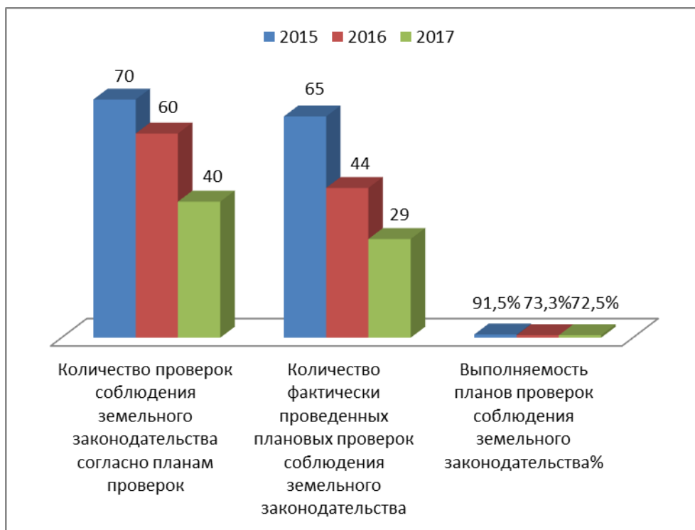
Рисунок 3. Значения показателя выполняемости планов

Средний показатель выполняемости планов в 2017 году составил 72,5 %, что ниже показателя предыдущего периода на 0,8 % и ниже показателя 2015 года на 19 % (рисунок 7).