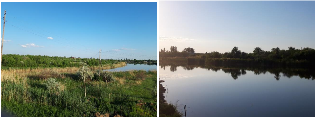
Фотофиксация объекта проектирования

(если предусмотрено программой практики)