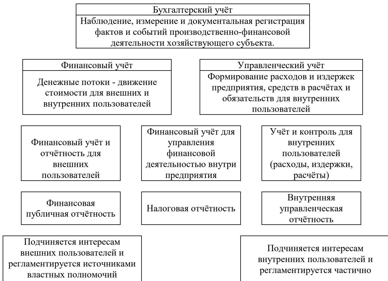
Рисунок 1 – Взаимосвязь финансового и управленческого учета

Дополните схему, представленную на рисунке, обозначив стрелки, символизирующие взаимосвязь компонентов схемы.