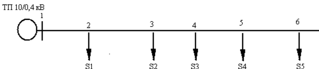
Рис. 2 Эквивалентная схема