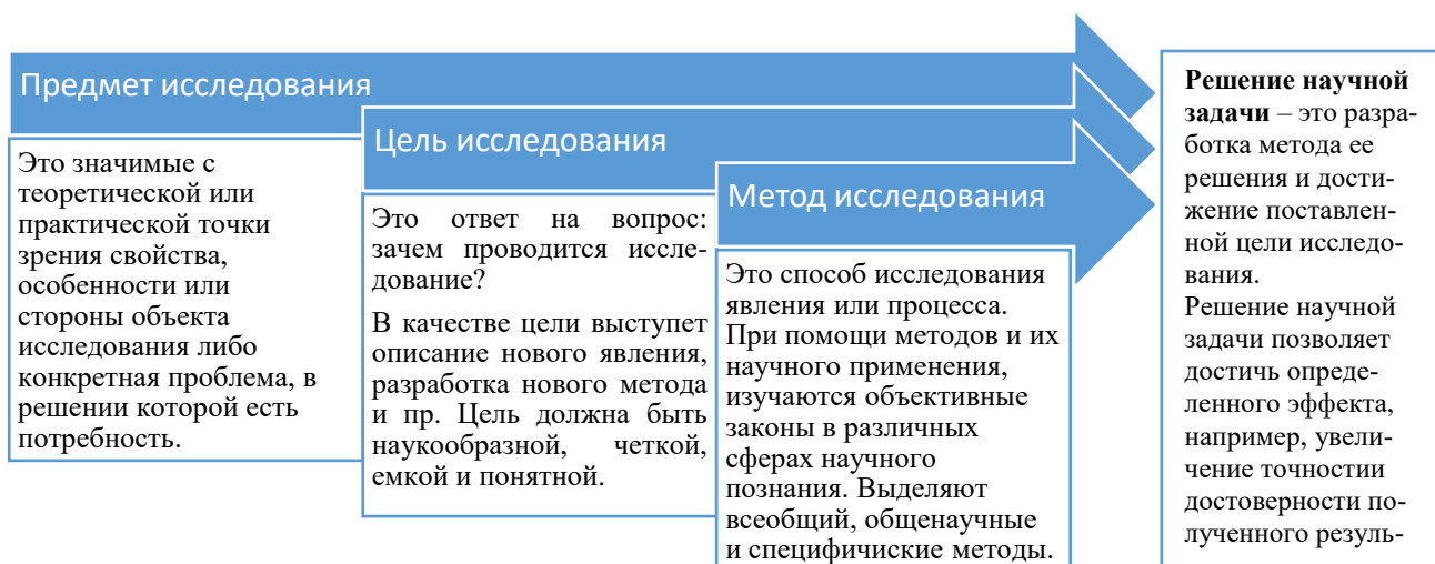
Рисунок 2 – Формализованный подход к решению научной задачи

Научная задача , как правило, посвящается развитию одного из разделов уже существующей теории. Научная задача отражает актуальные на сегодняшний день вопросы теории и практики, решение которых еще не найдено.