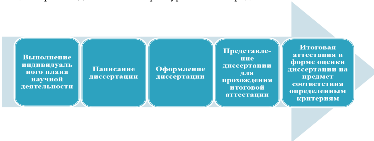
Рисунок 1 – Общие этапы подготовки диссертационной работы к итоговой аттестации 3

Работа над диссертацией – это длительный и трудоемкий процесс, поэтому если молодой исследователь планирует связать свое будущее с наукой, то обучение в аспирантуре является неотъемлемым элементом данной деятельности. В общих чертах подготовка в аспирантуре включает ряд обязательных этапов: