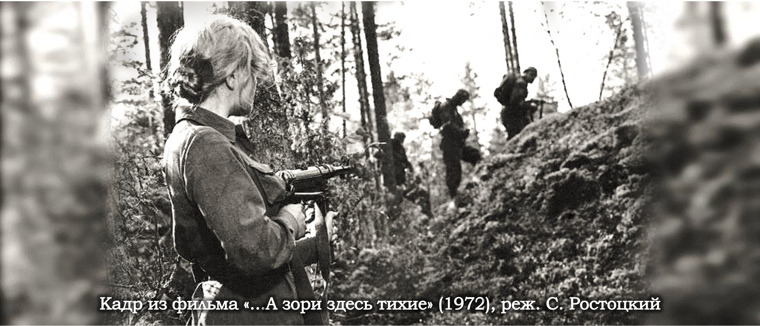
Кадр из фильма «...А зори здесь тихие» (1972), реж. С. Ростоцкий

Этот эпизод и лёг в основу повести. Но Васильев сделал главными героями девушек – этим книга резко выделялась на фоне других, посвященных войне.