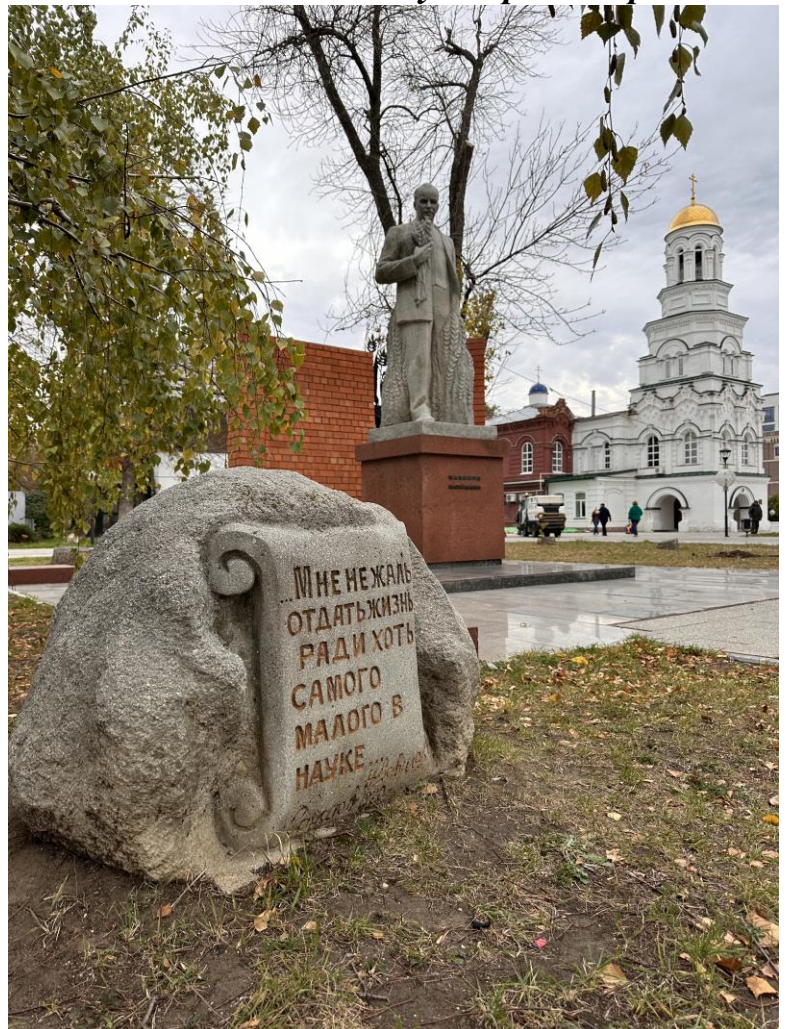
Памятник Н.И. Вавилову в городе Саратове.