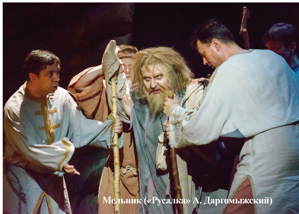
Мельник («Русалка» А. Даргомыжский)

Из-за него погибает художник Каварадосси. →