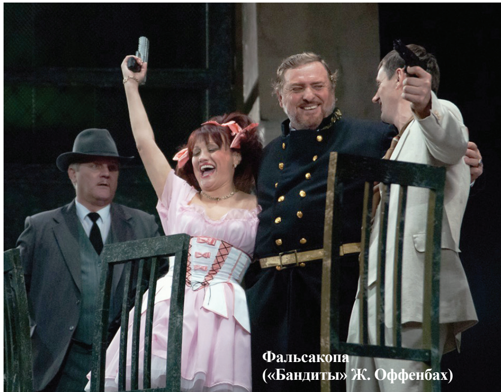
Фальсакопа («Бандиты» Ж. Оффенбах)

И в заключение. В наше сложное время борьбы с коронавирусом за физическое здоровье нации на передовой – врачи и весь медицинский персонал, а вот поддерживать душевное здоровье наших земляков – это задача людей творческих. Что мы и делаем каждый в меру своих возможностей.