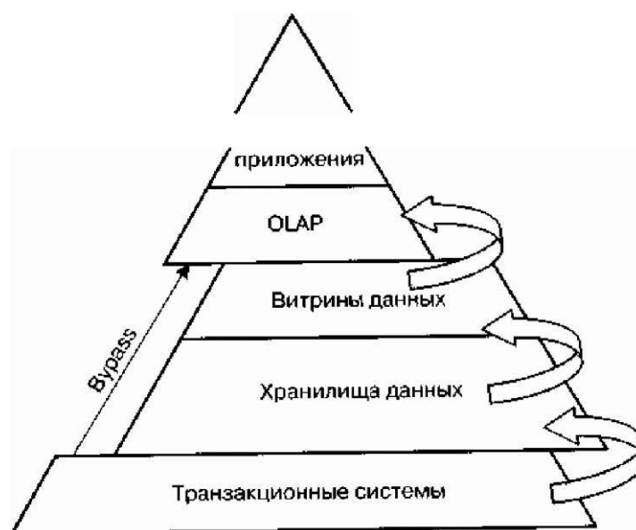
Рис. 4.1.1 Аналитическая пирамида

Основанием аналитической пирамиды служат ЕКР и другие транзакционные системы. По мере движения от основания пирамиды к ее вершине происходит постепенное преобразование детальных операционных данных в агрегированную информацию, предназначенную для поддержки принятия управленческих решений.