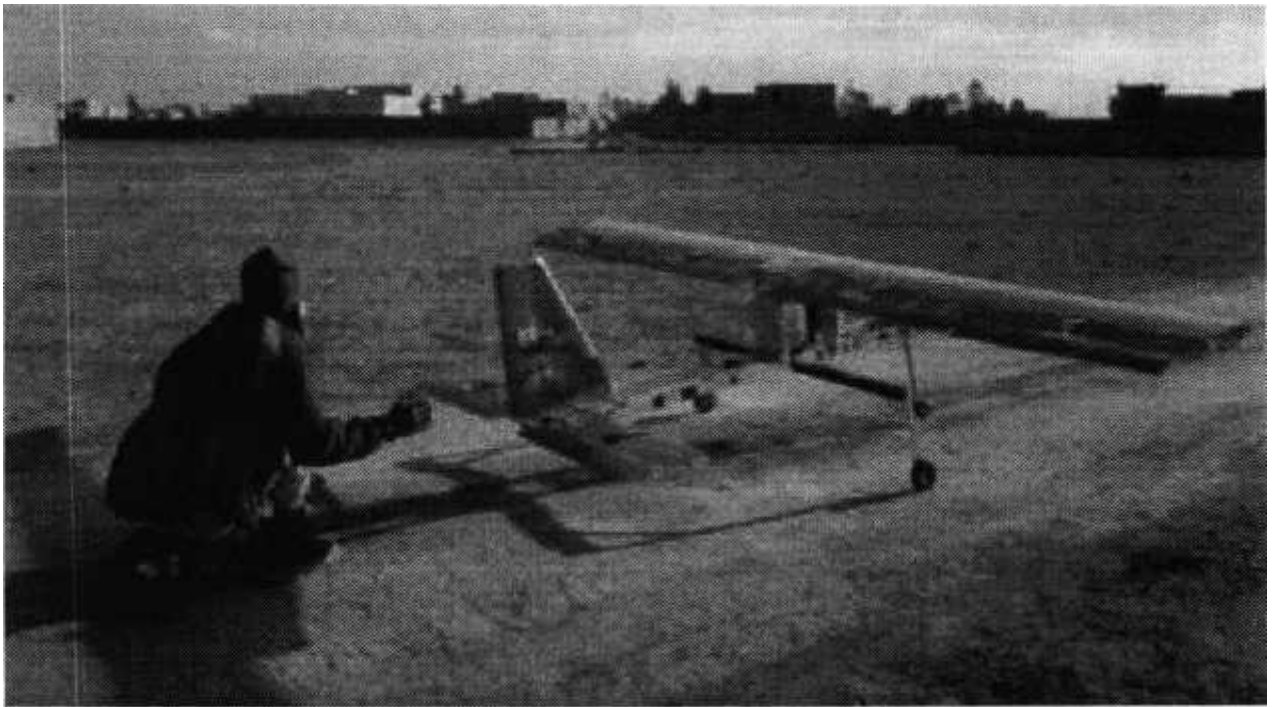
Рис. № 4 – малогабаритный летательный аппарат

Поэтому БВС-камикадзе специалисты называют «барражирующим боеприпасом». При весе в 10 – 20 кг беспилотник-самоубийца способен выполнять задачи на расстоянии 20 – 30 км от точки запуска.