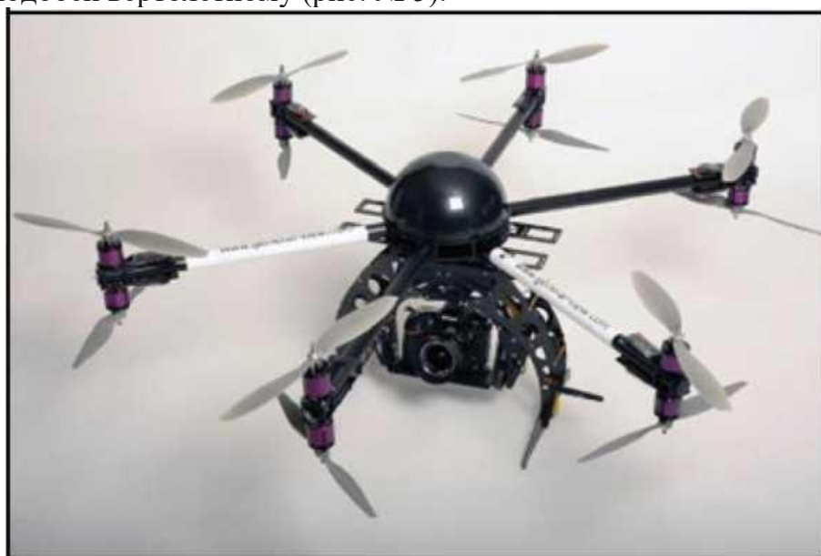
Рис. № 5 – многооторный БПЛА

Тип БПЛА, который с каждым днем получают все большее распространение, – многооторные системы. Их еще называют мультикоптерами, квадрокоптерами, гексакоптерами, октакоптерами и тому подобное, в зависимости от количества несущих винтов. Характерная особенность – многооторная система, принцип полета – подобен вертолетному (рис. № 5).