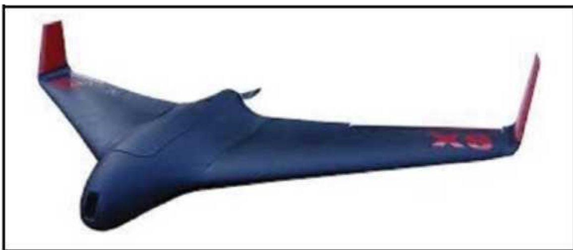
Рис. № 7 – БПЛА тип «летающее крыло»