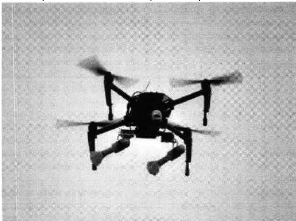
Рис. № 3 – квадрокоптер

Этот беспилотник может нести до двух взрывных устройств, снабженных стабилизаторами и простейшим контактным взрывателем ударного действия. В качестве системы крепления для гранат боевики используют отрезок пластиковой трубы, в которой с помощью лески закрепляется граната.