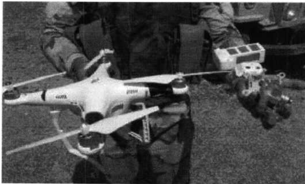
Рис. № 1 – БВС вертолетного типа

Для совершения диверсионных актов могут использоваться БВС самолетного и вертолетного типа (рис. № 1) кустарного производства, причем доля последних значительно превышает количество самолетных. Объясняется это в первую очередь их более низкой стоимостью.